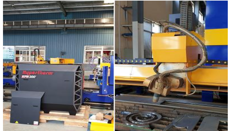
Lắp đặt máy CNC Hypertherm-Đồng Nai