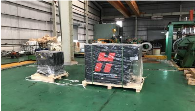
Lắp đặt máy CNC hypertherm-Tp.Hồ Chí Minh