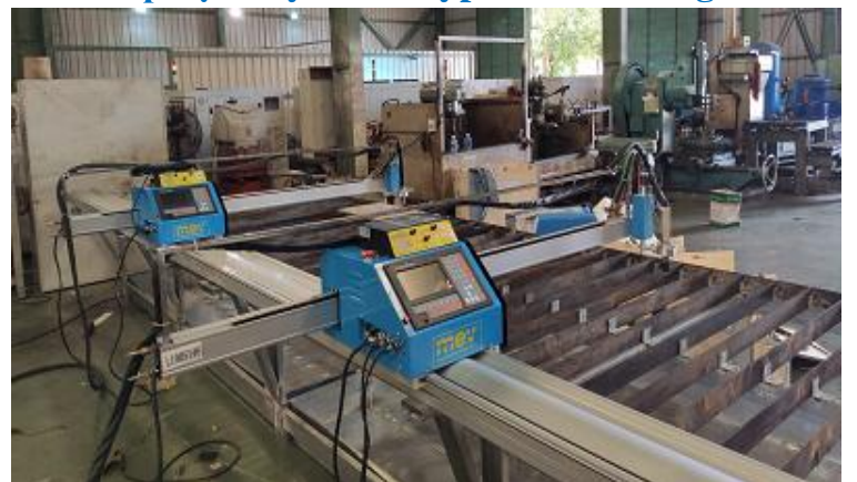
Lắp máy CNC MEV- Long An