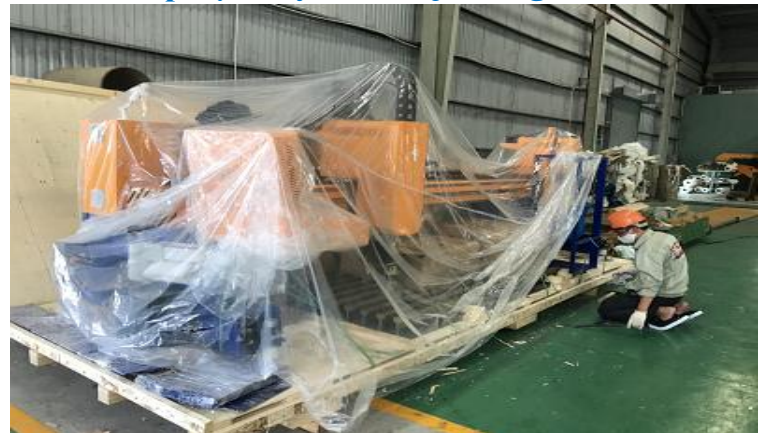
Lắp đặt máy CNC Bacor-Long An