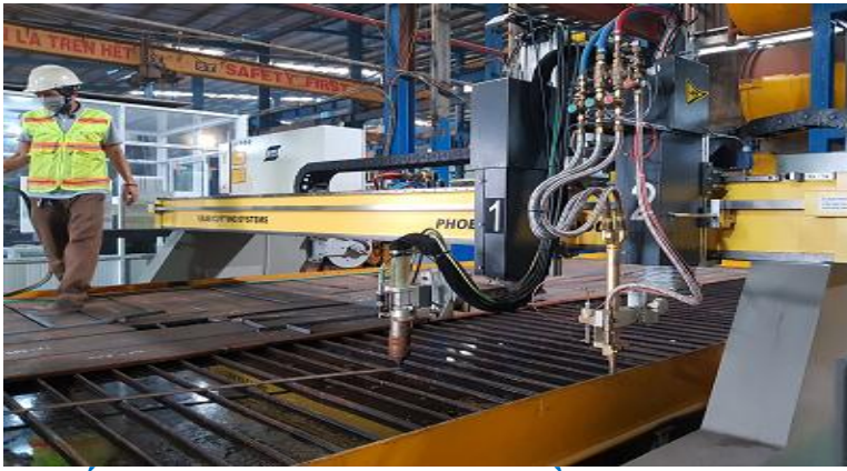
Lắp đặt máy CNC Esab-TP.Hồ Chí Minh