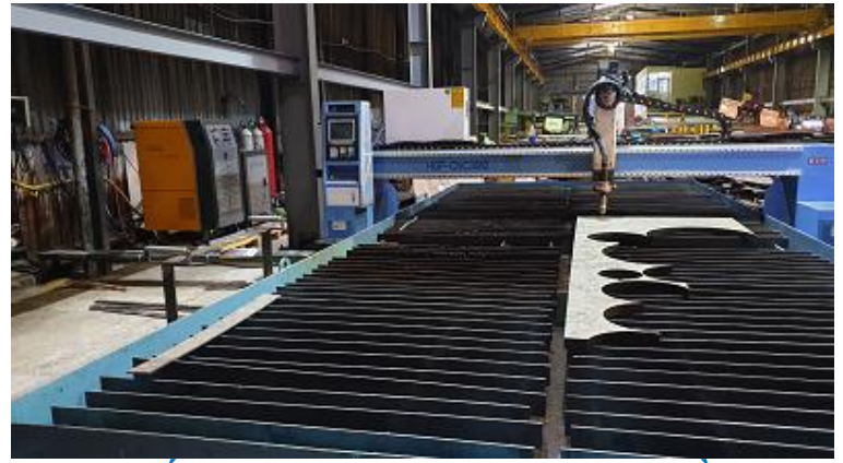
Lắp đặt máy CNC Kjelberg-TP.Hồ Chí Minh