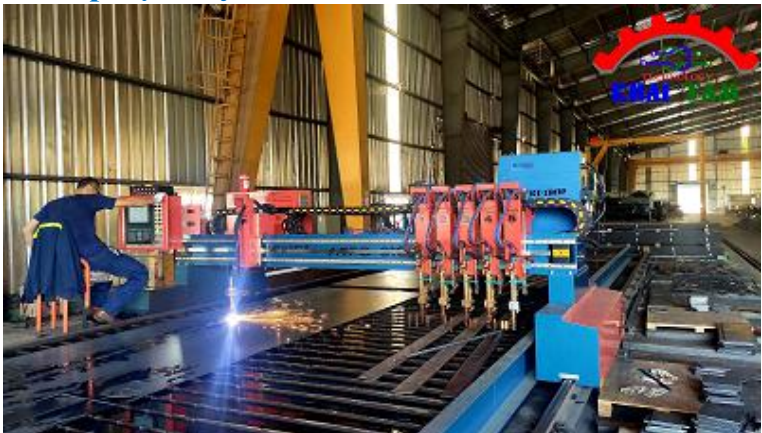
Lắp đặt máy CNC Autoweb-Long Thành-Đồng Nai