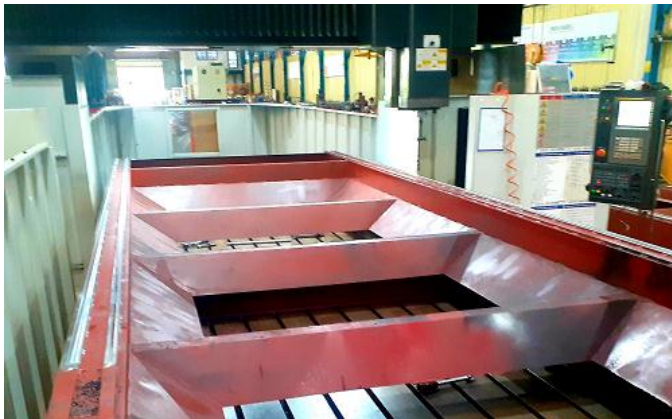
Khử Ứng Suất