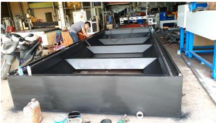
Lắp Thanh Trượt Và Thanh Răng