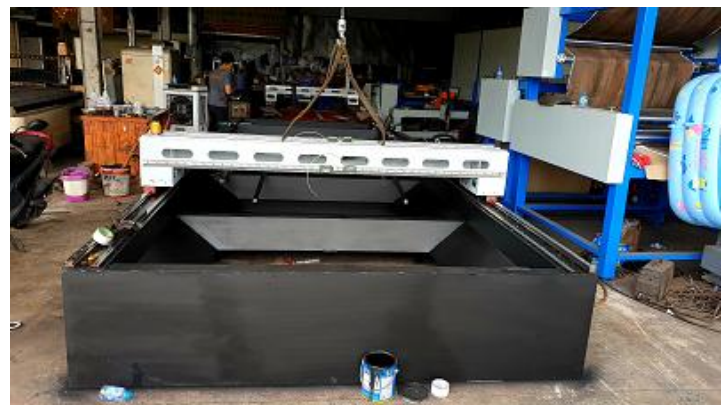
Lắp Dầm Ngang Và Căn Chỉnh