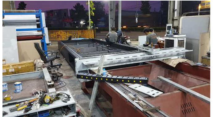
Sản Xuất Khung Máy