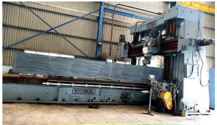
Phay CNC Bề Mặt