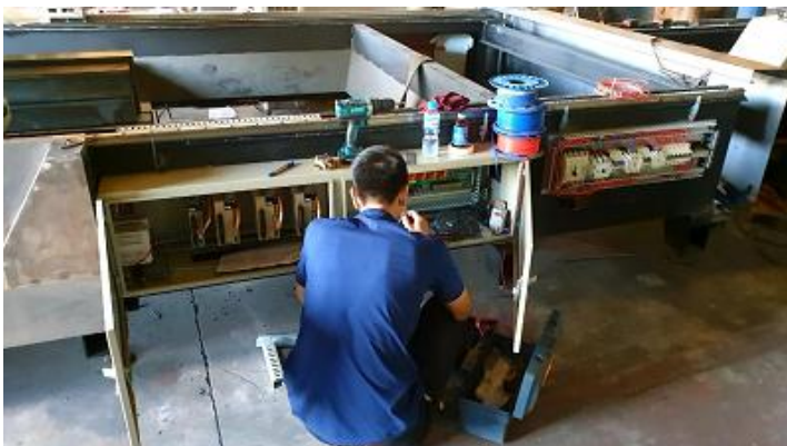
Lắp Tủ Điện